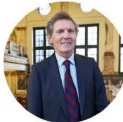
Donald Kalff Transparantie in rechtspraak